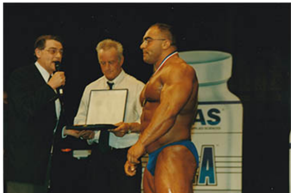
Met Nasser El Sonbathy recent overleden op 20 maart 2013.